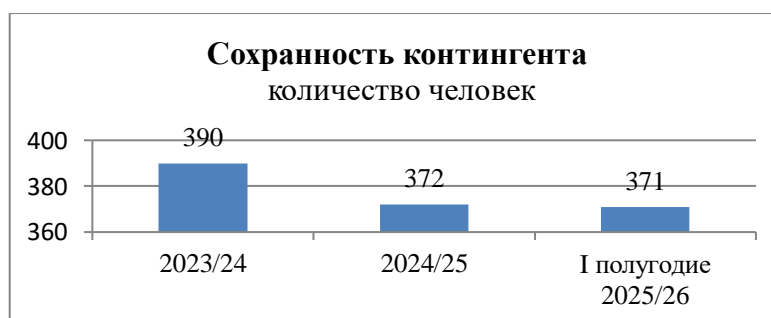
Сохранность контингента за 3 года

Количество обучающихся в классе составляет в среднем 23 человека.